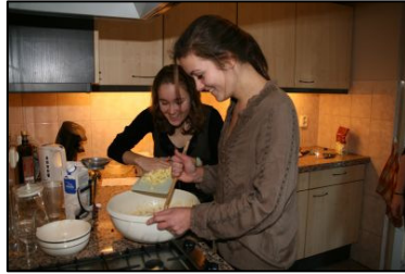
Oliebollen maken voor verkoop oudjaar