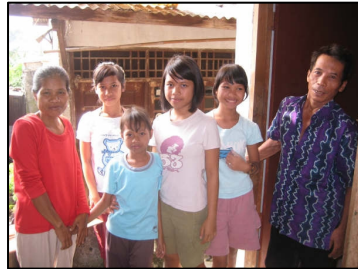
Yeni en haar familie