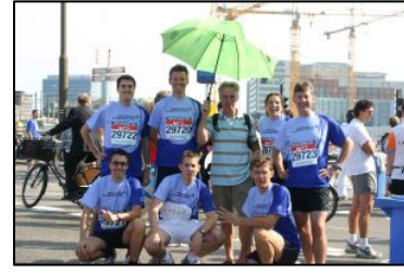
DMV deelname van Dam tot Dam Loop